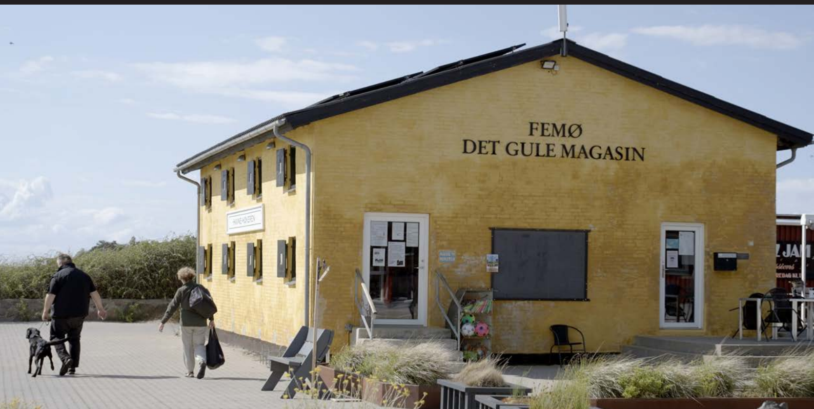
I det Gule Magasin på Femøs havn holder Havnehøkeren til.